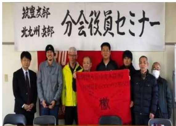
九州地区本部委員会