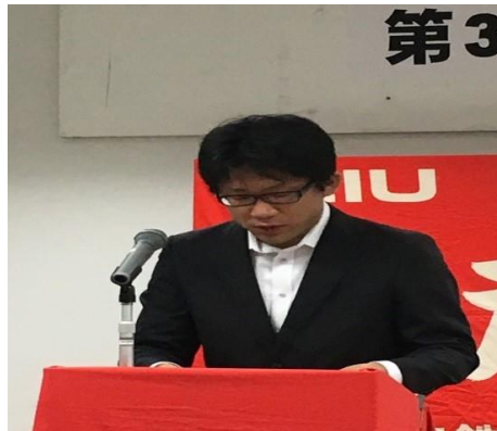
新井中央執行委員