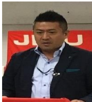
J R 連合政所企画部長